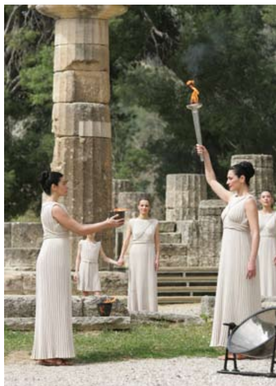
Η αφή της Ολυμπιακής φλόγας στην Αρχαία Ολυμπία

Η Λαμπαδηδρομία επί ελληνικού εδάφους, κράτησε 7 ημέρες και διήνυσε 1.528 χιλιόμετρα στα χέρια 629 δρομέων, διέσχισε 16 Νομούς της χώρας,