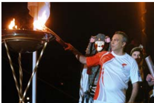
Ο Νίκος Γκάλης άναψε το βωμό στη Θεσσαλονίκη