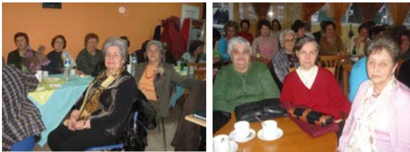
Στις 22 Μαρτίου τα μέλη μας παρακολούθησαν τη θεατρική παράσταση «ΑΓΑΝΤΑ» με τον Χάρυ Κλύνη στο θέατρο «ΑΘΗΝΑΙΟΝ» και στις 28 Μαρτίου η χορωδία του Κ.Α.Π.Η. επισκέφθηκε το Κ.Α.Π.Η. Μηχανιώνας για γνωριμία μεταξύ των μελών.