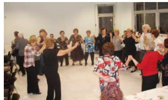
Στις 19 Μαρτίου η χορωδία και το χορευτικό επισκέφθηκαν το Μακεδονικό Μουσείο του Δήμου Κοιλινδρού και στη συνέχεια το Κ.Α.Π.Η. Κοιλινδρού όπου παρουσίασαν κομμάτι της δουλειάς τους και γνωρίστηκαν με τα εκεί μέλη.