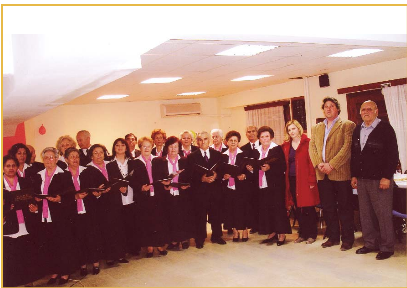
4/3: Το χορευτικό και η χορωδία μας επισκέφτηκαν το Κ.Α.Π.Η. Νιγρίτας