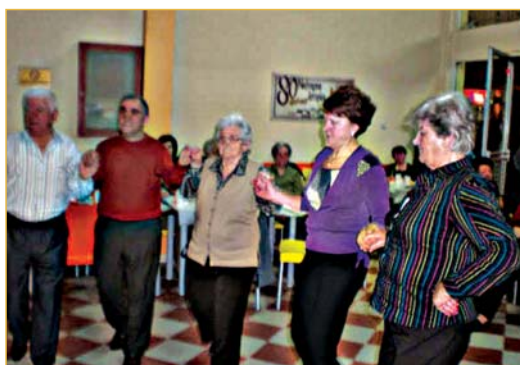
Στις 09/03 έγινε επίσκεψη των ΚΑΠΗ ΜΗΧΑΝΙΩΝΑΣ.