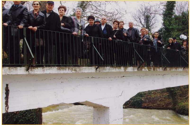
Από τη μονοήμερη εκδρομή στο Σπήλαιο Μαράα

13/3: Πραγματοποιήθηκε στο Κ.Α.Π.Η. ομιλία με θέμα "Παθήσεις του προστάτη και νέες θεραπείες" σε συνεργασία με τον Ουρολόγο κο Κωνσταντίνο Βακαλίδη. 26/3: Υλοποιήθηκε στο Κ.Α.Π.Η. μέτρηση οστικής πυκνότητας (οστεομέτρησης) σε κυρίες μέλη μας, σε συνεργασία με τη Γενική Γιατρό κα Οικονομίδου Ειρήνη και τον Ειδικευόμενο Γιατρό κο Καλαϊτζίδη Δημήτριο. 29/3: Μονοήμερη εκδρομή στο Σπήλαιο Μαράα και στη Δράμα.