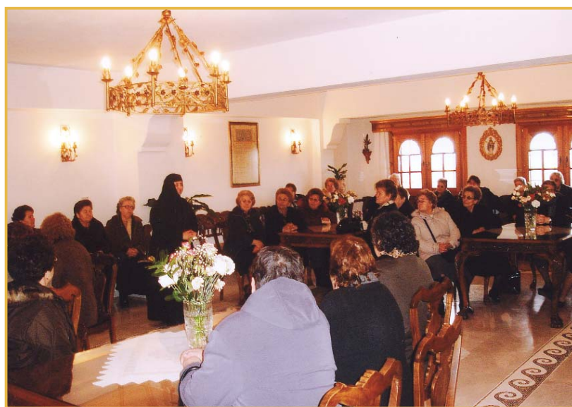
26/3: Απογευματινή εξόρμηση στη Μονή του Γρηγορίου του Παλαμά στα Κουφάλια όπου τα μέλη μας παρακολούθησαν τον Μέγα Απόδειπνο.