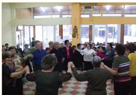
Στις 31/03 έγινε επίσκεψη των ΚΑΠΗ ΜΕΛΙΣΣΟΧΩΡΙΟΥ- ΛΗΤΗΣ.