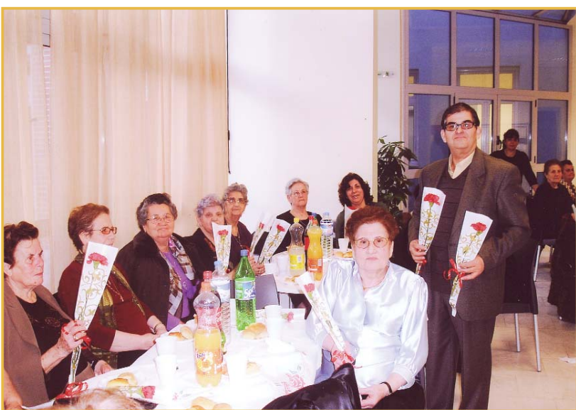
8/3: Με αφορμή την Παγκόσμια Ημέρα της Γυναίκας πραγματοποιήθηκε στο Κ.Α.Π.Η. εκδήλωση για τις κυρίες μέλη μας.