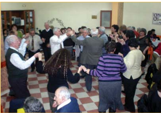
Στις 06/03 έγινε επίσκεψη των ΚΑΠΗ ΛΑΓΚΑΔΑ-ΣΤΑΥΡΟΥ.