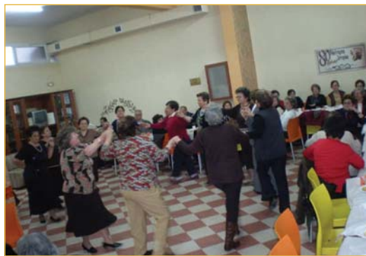
Στις 18/03 έγινε επίσκεψη των ΚΑΠΗ ΒΑΣΙΛΙΚΩΝ- ΑΓΓΕΛΟΧΩΡΙΟΥ.