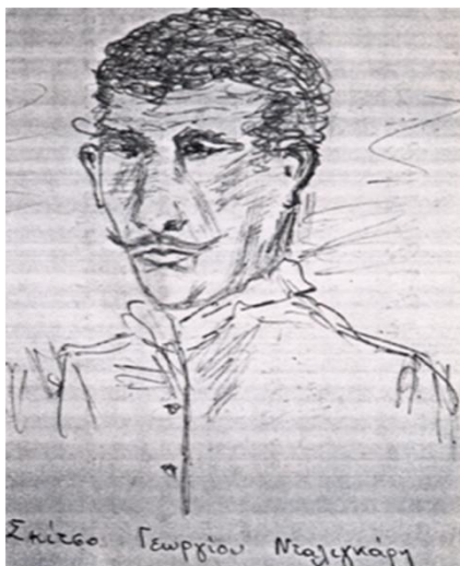
Εικ. 7: Σκίτσο του Γεωργίου Νταλιγκάρη.

εργαλείο στα χέρια να τα συνοδεύει με τραγούδια πατριωτικά. Σε λίγο όλοι οι Κουλιακιώτες άρχισαν να εργάζονται πυρετωδώς. (Βαφειδής, 1967, σελ. 29).