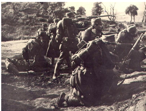
Εικ. 2: Η μάχη στο Σαραντάπορο (9/10/192).

ελληνικού στρατού στο Σαραντάπορο (εικ. 2) ενίσχυσε το ηθικό του και άνοιξε τις πύλες για την απελευθέρωση της Μακεδονίας. Μετά την ήττα των Τούρκων στο Σαραντάπορο, η Στρατιά Θεσσαλίας στράφηκε προς τα ανατολικά, με σκοπό την απελευθέρωση το ταχύτερο της Θεσσαλονίκης, που αποτελούσε τον κύριο πολιτικοστρατηγικό σκοπό των επιχειρήσεων στη Μακεδονία. Το πρωί της 15 ης Οκτωβρίου, η VII μεραρχία κατέλαβε την Κατερίνη και στις 16 Οκτωβρίου ο ελληνικός στρατός μπήκε στη Βέροια.