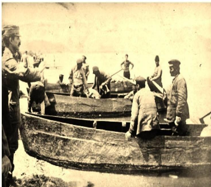
Εικ. 8: Σπανιότατη φωτογραφία λίγο πριν από την κατασκευή της πλωτής γέφυρας του Αξιού και κατά τη διάρκεια της προετοιμασίας και μεταφοράς των πλαβών (βαρκών) στο σημείο της σχεδιαζόμενης ζεύξης.

Πολύ παραστατική είναι η περιγραφή του Κ. Βαφείδη: «Πρώτα-πρώτα δέθηκε, από στερεούς πασσάλους μπηγμένους στις όχθες του ποταμού, ένα πελώριο σε μήκος παλαμάρι και άρχισε με γοργό ρυθμό η εργασία. Μία-μία οι πλάβες (εικ. 8) πλησίασαν και δέθηκαν κάθετα με το παλαμάρι, στερεώθηκαν καλά με τις άγκυρες και άρχισαν να δέχονται τα μαδέρια που κουβαλούσαν οι φαντάροι με τους εθελοντές πολίτες. Τα σφυριά και οι βαριές δούλευαν ακατάπαυστα ξεσηκώνοντας μεγάλο θόρυβο. Θα νόμιζε κανείς ότι βρισκόταν σε μεγάλο ναυπηγείο». (Βαφείδης, 1967, σελ. 29).