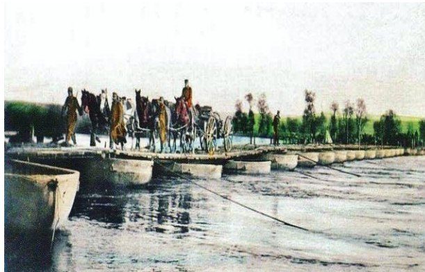
Εικ. 1: Η λεμβόζευκτη γέφυρα του Αξιού που κατασκευάστηκε από τους Χαλαστραίους πολίτες και τους στρατιώτες της VII ης Μεραρχίας (αναμνηστικό επιστολικό δελτάριο).

Η συλλογική εθνική μνήμη έχει τοποθετήσει τους Βαλκανικούς πολέμους του 1912-1913, όχι άδικα, πολύ ψηλά στα επιτεύγματα του Ελληνισμού. Οι Βαλκανικοί πόλεμοι συνέβαλαν αποφασιστικά στην παγίωση των βαλκανικών συνόρων στο σημερινό status quo, με όσες ανακατατάξεις προέκυψαν μετά τους δύο Παγκόσμιους πολέμους που ακολούθησαν. Η Ελλάδα ξεκίνησε μία αναμέτρηση ενάντια στην Οθωμανική Αυτοκρατορία, ως μέλος μιας βαλκανικής συμμαχίας, με αντικειμενικό σκοπό την απελευθέρωση των κατακτημένων εδαφών τόσο στην Ήπειρο, όσο και στη Μακεδονία, στη Θράκη και στα νησιά του Αιγαίου.